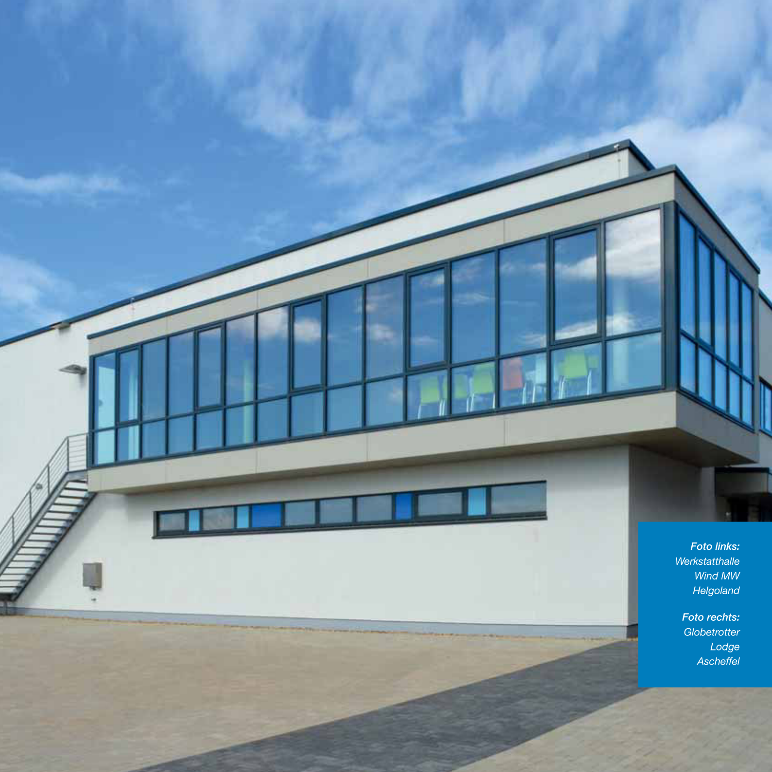
Foto links: Werkstatthalle Wind MW Helgoland

Foto rechts: Globetrotter Lodge Ascheffel