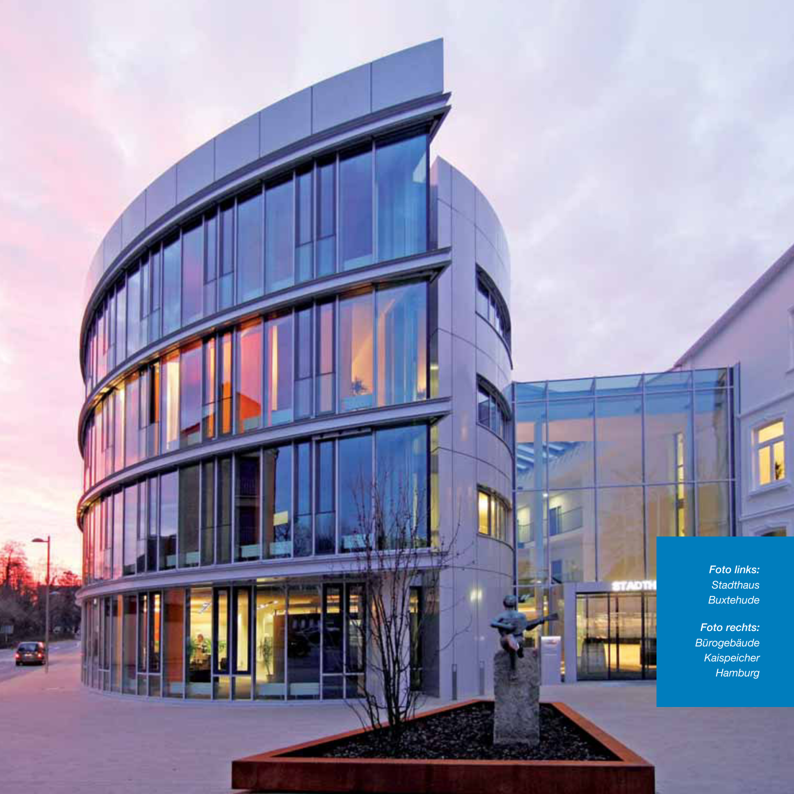
Foto links: Stadthaus Buxtehude

Foto rechts: Bürogebäude Kaispeicher Hamburg